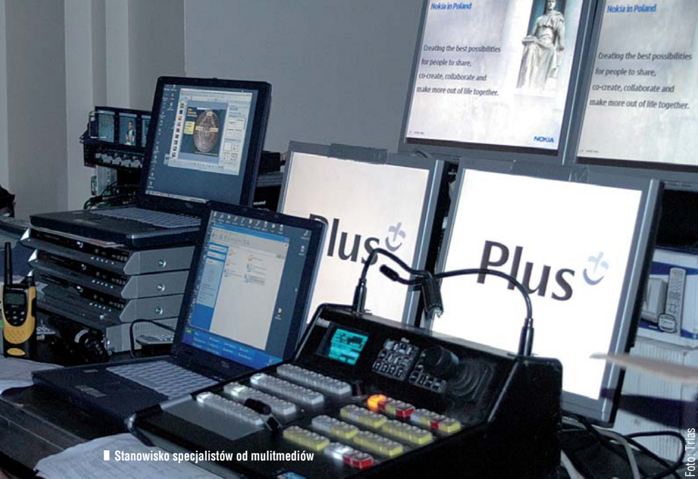
■ Stanowisko specjalistów od multimedów