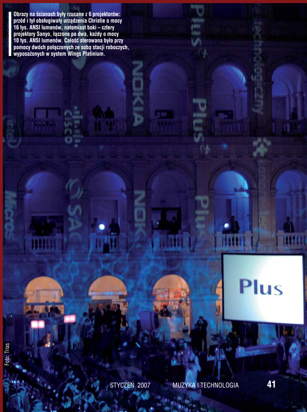
Obrazy na ścianach były rzucane z 6 projektorów: przód i tył obsługiwały urządzenia Christie o mocy 16 tys. ANSI lumenów, natomiast boki – cztery projektory Sanyo, łączone po dwa, każdy o mocy 10 tys. ANSI lumenów. Całość sterowana była przy pomocy dwóch połączonych ze sobą stacji roboczych, wyposażonych w system Wings Platinum.

diodowy Barco-ILite XP o rozmiarach 6x 3,8 metra, zamontowany w ramie na rolkach, co umożliwiło rozdzielenie go na 2 części i rozsuniecie na odległość 10 metrów. Po obu stronach sceny umieszczono ekrany wyświetlające obrazy z projektorów.